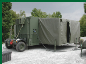
Kontenery dowodzenia taktycznego