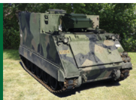
Jednostki dowódcze i kontrolne